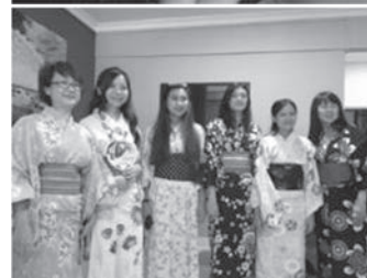
JCTIC との交流会 浴衣姿 マリーナコートにて