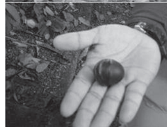
でかい！ダンゴムシ しっかり閉じている キナバル植物園にて