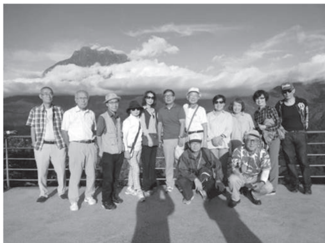
キナバル山をバックに 全員集合