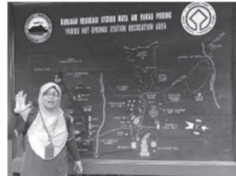
元気深刺ガイドさん案内板前で諸注意・・・ キナバル植物園にて