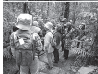
かわいいランを探す葉影にもひっそりと キナバル植物園にて