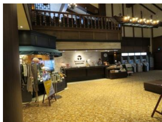
コースとクラブハウス

今回のご案内では一度はプレーをしてみたい太平洋クラブ軽井沢リゾートコース、そこでのゴルフ企画でしたので直ぐに申込みました。日ごろはWSCの催しに出席率が？の私ですが、最近では顔なじみの方ができたので、イベントへ参加することにも殆ど躊躇することがなくなっていたところでした。