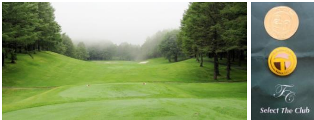
霧にむせんでロマンティック

東京都世田谷区にお住いの会員のご手配により、名門コースで久方ぶりのゴルフ同好会を催しました。お天気の状況は残念でしたが、シルバーパワーで大いに楽しみました。