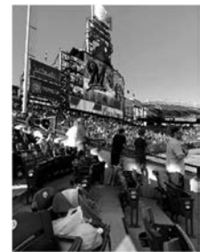
メジャーリーグの賑わい

土曜日にデンバーに行き、メジャーリーグの野球コロラド・ロッキーズ対ミルウォーキー・ブルワーズの試合を見て、次の日にフォートコリンズに帰る経験もしました。地元の小学生が大勢グラウンドに立ち、試合が始まる前にアメリカ国歌を歌っているのとてもかわいいものでした。