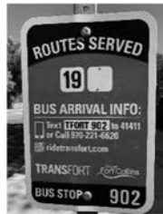
バス停には QR コード

私の CSU 滞在中、WSC 一団の公式訪問が9月20日にありました。私はバスに乗り、ホテルで合流です。バス停には、時刻表がありません。スマホでバス停にある QR コードを読み取ると時刻表が出てきて、しかもバスが何時に来るかわかるようになっていきます。