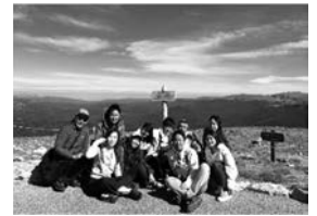
ロッキー山脈をバックに記念撮影

CSU には関西外語大学の学生が何人かいて、日本語授業の手伝いをしていました。週末にはその学生達とロッキー山脈のドライブに行き、綺麗な景色や動物を見た楽しい1日を過ごしました。