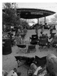
ダウンタウンでダンス

CSU は、コロラド州のフォートコリンズにあり、きれいな街並みをもっています。いろいろな場所へ行きました。ダウンタウンの広場では、ライブの音楽でダンスをしたりお酒を飲んだりしている人を多く見かけ、とても楽しい雰囲気でした。このダウンタウンへは、趣味のポケモンゲットでよく行きました。